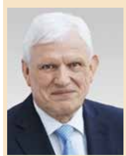
Peter Trapp, MdB

Die CDU fordert den Senat auf, entsprechend dem bereits bestehenden elektronischen Hinweisgebersystem zur Korruptionsbekämpfung ein elektronisches Hinweisgebersystem zu beschaffen und anzuwenden, das der Entgegennahme von anonymen Hinweisen zur Bekämpfung der organisierten Kriminalität (z. B. § 261 StGB: Geldwäsche; Verschleierung unrechtmäßig erlangter Vermögenswerte, Mord und Totschlag) durch das Landeskriminalamt Berlin dient.