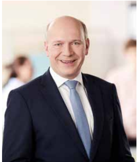
Der Spandauer Bundestagsabgeordnete Kai Wegner