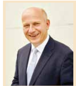
Kai Wegner, Vorsitzender der CDU Berlin

Die Vereinbarkeit von Familie und Beruf ist im Alltag oft eine organisatorische Herausforderung. „Eine Politik der fairen Chancen orientiert sich an der Lebenswirklichkeit von Frauen und Männern und setzt sich dafür ein, diese miteinander zu verbinden“, sagte der CDU-Landesvorsitzende Kai Wegner.