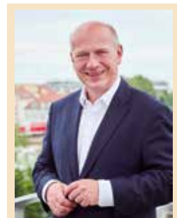
Kai Wegner Bundestags- abgeordneter für Spandau

Schreiben Sie mir gern, wie Sie sich Berlin 2040 vorstellen: kai.wegner@cdu.berlin