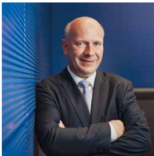
Der Spandauer Bundestagsabgeordnete Kai Wegner