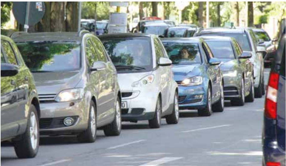
Staus im Spandauer Süden.