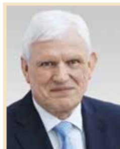
Peter Trapp, MdB

Anlässlich einer Bürgersprechstunde in meinem Wahlkreis Gatow/Kladow wurde ich auf das seit längerer Zeit andauernde, gesetzwidrige Fahren auf der Unterhavel mit erheblich überhöhter Geschwindigkeit und erheblichen Lärmemissionen und hohem Wellenschlag hingewiesen und ich habe mich mit den Beschwerdeführenden ausführlich ausgetauscht.