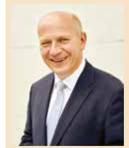
Kai Wegner, MdB

Womöglich lesen Sie diese Zeilen im Kerzenschein Ihres Adventskranzes, denn Weihnachten, das Fest der Hoffnung, steht bereits vor der Tür. Auch wenn wir die Weihnachtstage in diesem Jahr womöglich anders feiern als