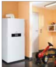
VITODENS 333F von Viessmann

Notdienst /Kundendienst Tel. 0172-787 56 20