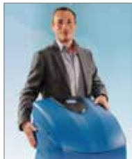
AQA Perla von BWT