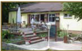
Restaurant „DIE TENNE“ Am Rehweg 22 14476 Potsdam/Neu Fahrland direkt an der B2

© 2016 Dettmer-Besier Immobilien – Kurpromenade 70 – 14089 Berlin – Telefon: 030 / 368 033 05