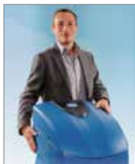
AQA Perla von BWT