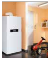
VITODENS 333F von Viessmann

Notdienst /Kundendienst Tel. 0172-787 56 20