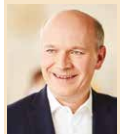
Kai Wegner MdB für Spandau

Dass die Unionsfraktion Familien in den Mittelpunkt stellt, zeigt sich neben dem Familienentlastungsgesetz und der Einführung des Baukindergeldes auch in weiteren Projekten. Rund 5,5 Milliarden Euro sollen in Qualitätsverbesserungen, Kindertagesstätten und Beitragsreduzierungen fließen. Für Kinder im Grundschulalter fordert die Unionsfraktion einen Anspruch auf Nachmittagsbetreuung. ■