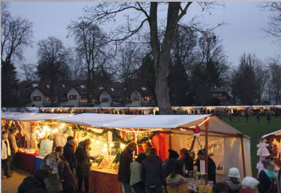
Der Christkindlmarkt in der Abenddämmerung