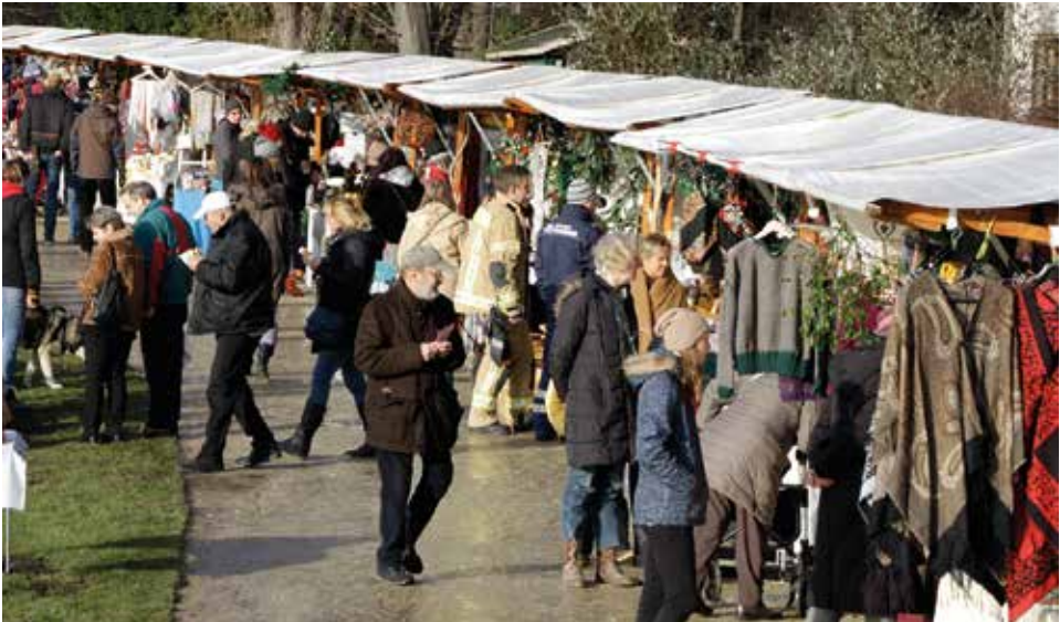
Der Christkindlmarkt am Imchenufer