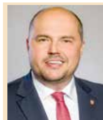
Frank Bewig, CDU, Bezirksstadtrat für Bauen, Planen und Gesundheit

Sportvereine, Kirchen, Kulturvereine, Jugendhilfeträger und Sozialhilfeträger bilden das soziale Rückgrat eines Wohnumfeldes. Auch in Gatow und Kladow gibt es bereits viele engagierte Bürgerinnen und Bürger, die sich zusammentun, um das soziale Umfeld und somit die Lebensqualität aller zu erhalten und stetig zu verbessern.